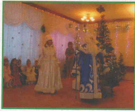
Здравствуй, дедушка Мороз!