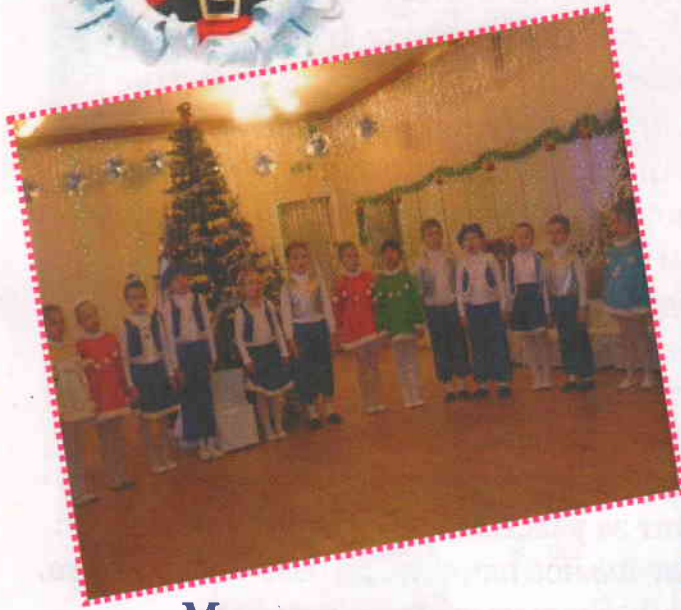
Мы стихи читаем, Новый год встречаем