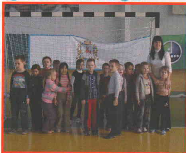
Путешествие в страну физкультуры