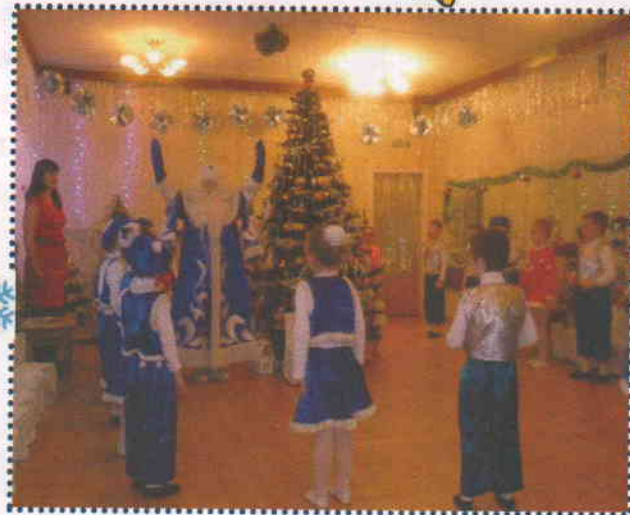
Весёлый хоровод вокруг ёлки