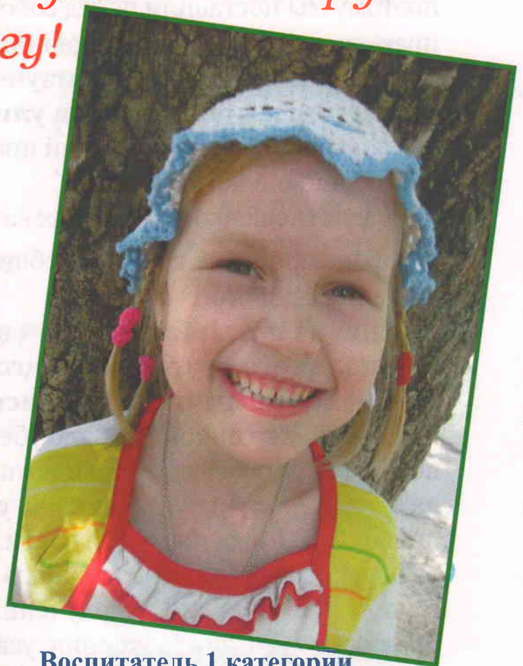
Воспитатель 1 категории