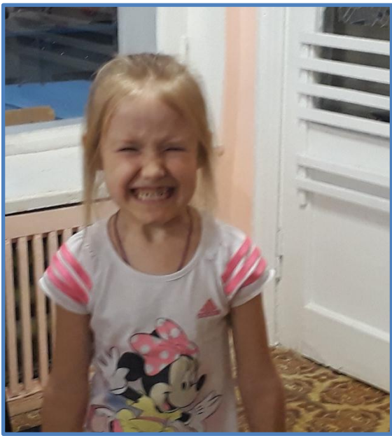
Я умею злиться..