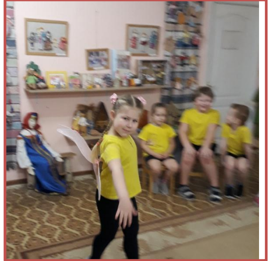
В образе доброй феи