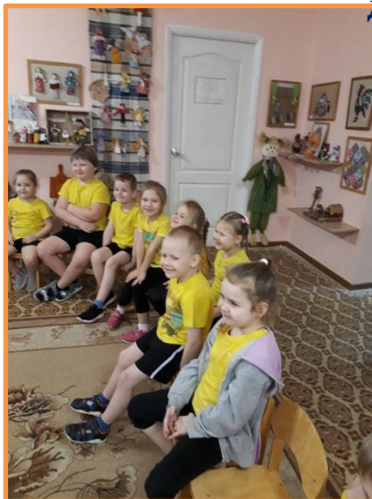
И зрители ,и актеры и группа поддержки!