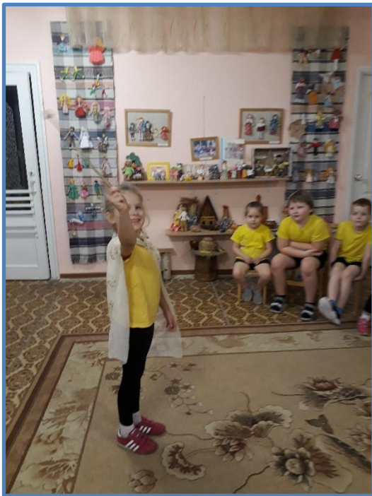
Сегодня я волшебник!